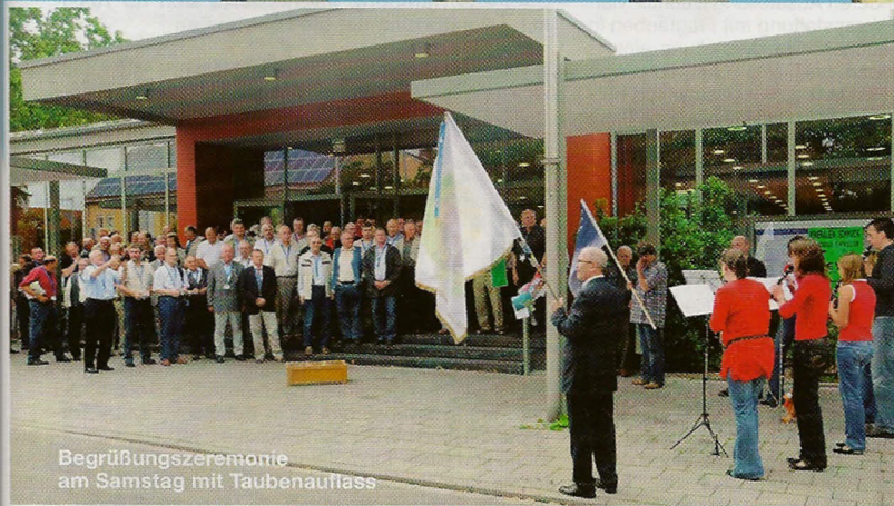
Begrüßungszeremonie am Samstag mit Taubenauflass